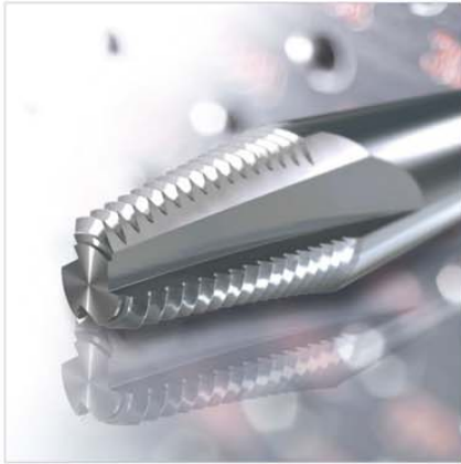
Kegel-Innen-Gewindefräser Conical inner thread milling cutter