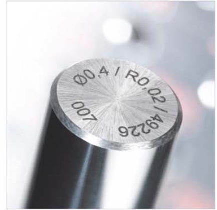
Reproduzierbarkeit durch Protokollierung und Ident-Nr. Reproducibility thanks to recording and life cycle no.