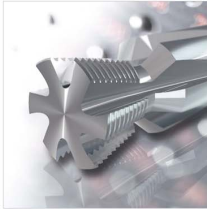
Kegel-Außen-Gewindefräser Conical external thread milling cutter